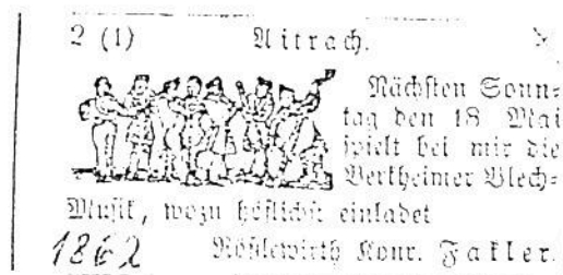
Einladung zum Maitanz 1862